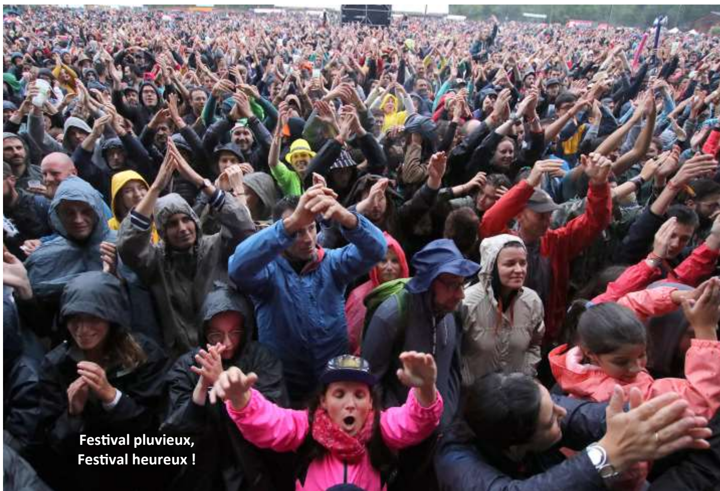
Festival pluvieux, Festival heureux !

Belle réussite également pour les journées Écaucitoyennes malgré une météo peu clémente le samedi. Le marché gourmand et les Arts de rue ont séduit un nombreux public. Les deux conférences ont réuni un public abondant en abordant le thème de la concentration dans le monde de la musique et celui des migrants en méditerranée. La scène off, issue de l'audition de 160 artistes émergents, a connu en journée une très forte fréquentation et a enchanté son public.