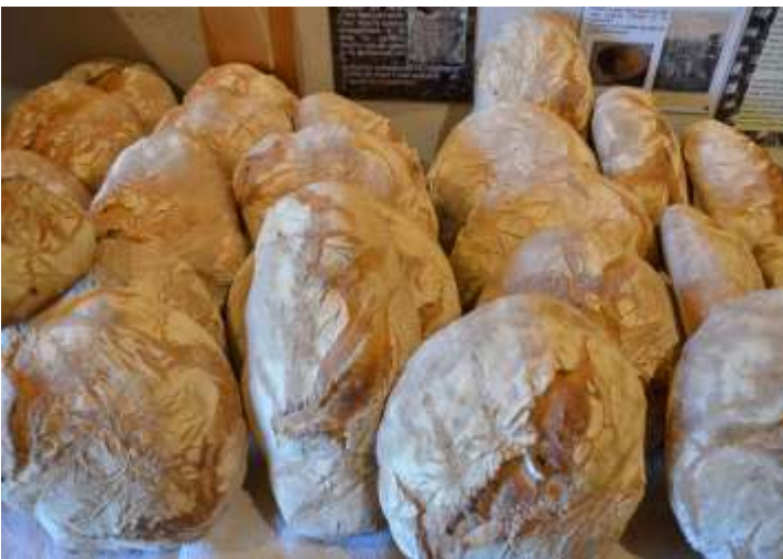
La fournée du 26 octobre 2019 : une réussite !

Le four de La Sotte est tombé en ruines depuis déjà plusieurs décennies. Il pourrait renaître au cours des années à venir avec le soutien de l'association Lo Patrimòni. Les habitants du hameau ont conduit une étude de faisabilité et opté pour un chantier participatif, à l'image de ce qui se fait actuellement